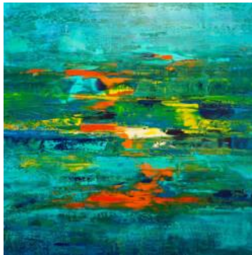
Paths to happiness,