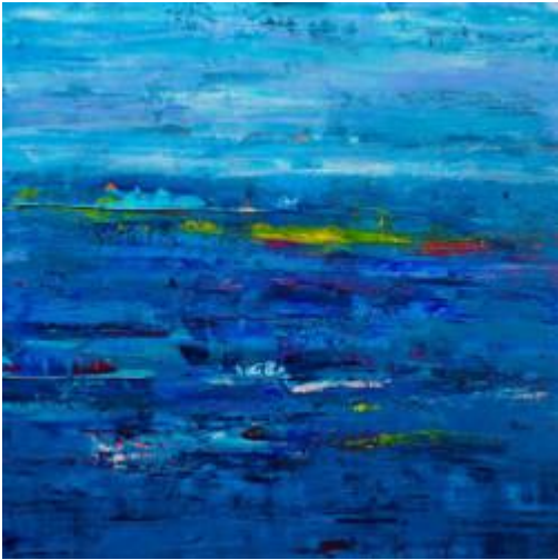
Waves of dolphins joy, .....