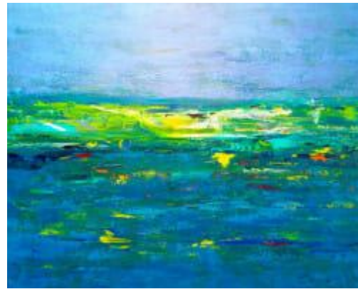
Day for a daydream