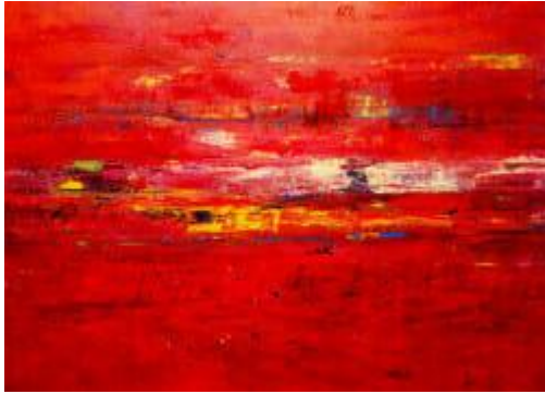
A journey through time, .....