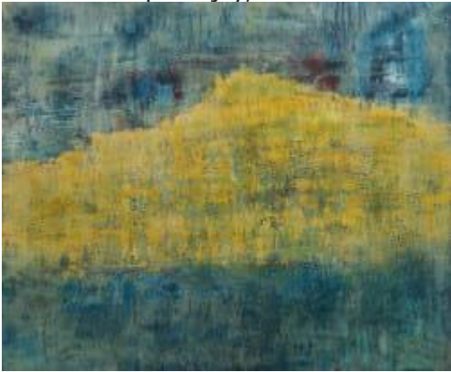
Golden mountain, .....