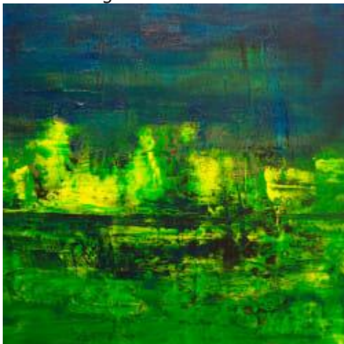
Feeling part of nature,