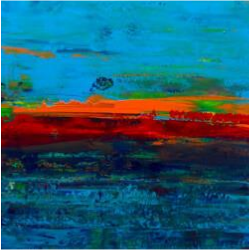
Choices have consequences, .....