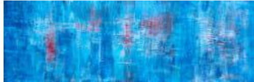
I love Pariž